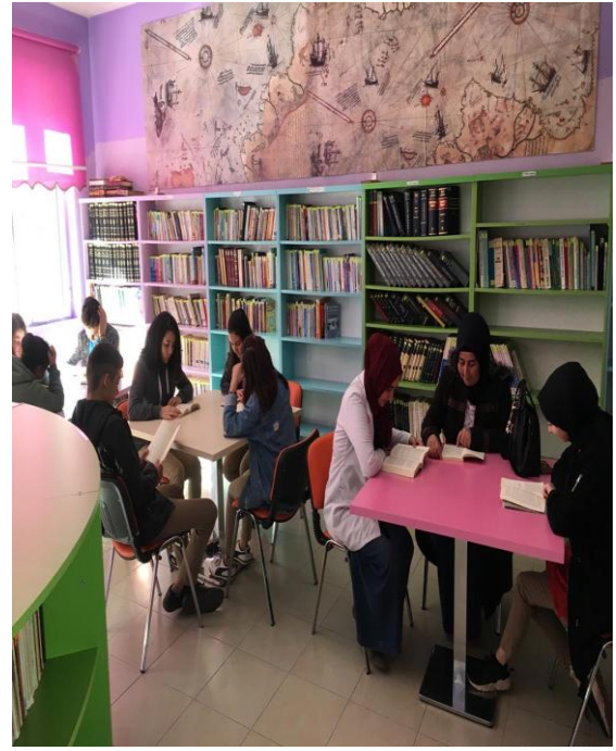
Gümüşhaneler Okuyor Projesi