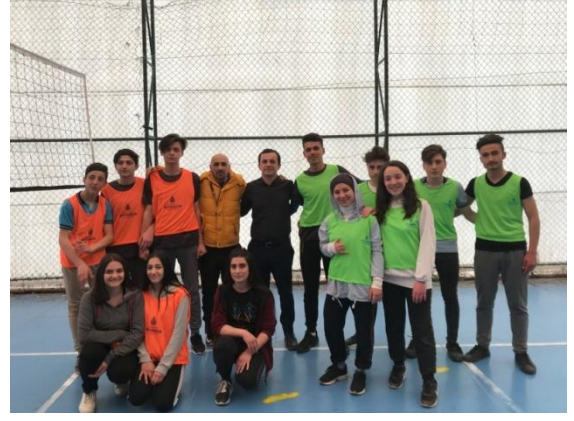
Geleneksel Voleybol Turnuvası