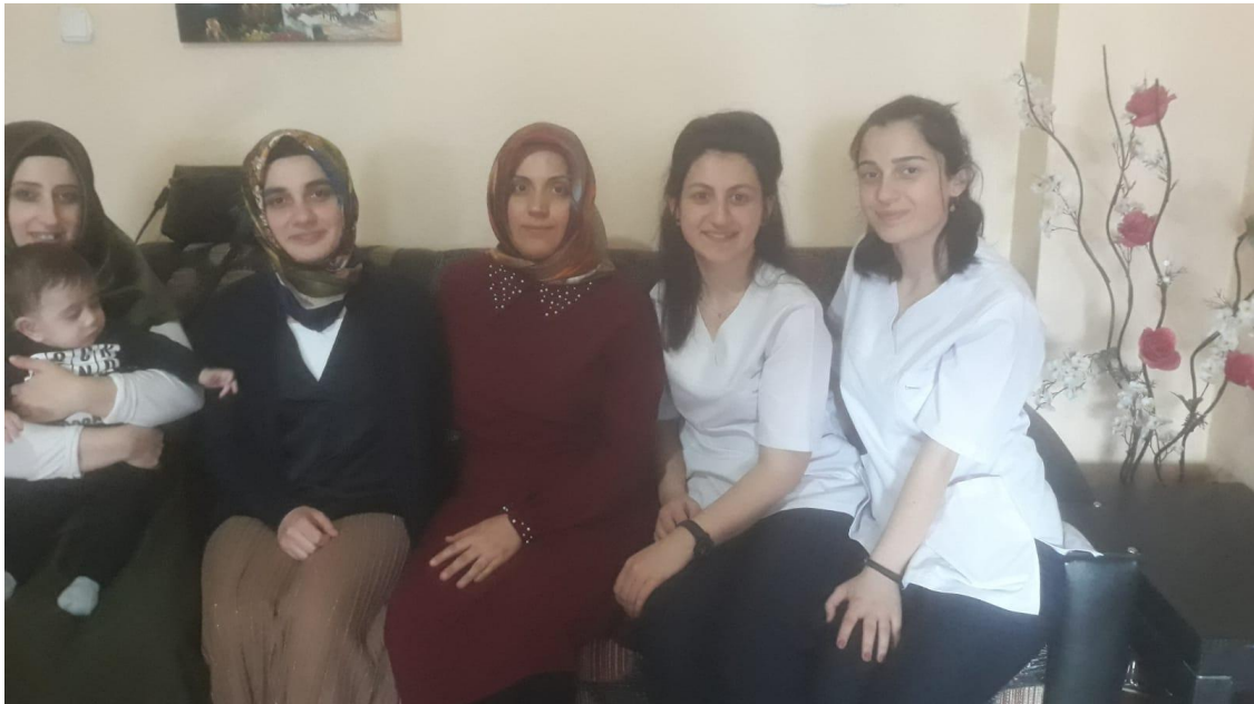
Meslek Liseliler Ailelerle Buluşuyor Projesi