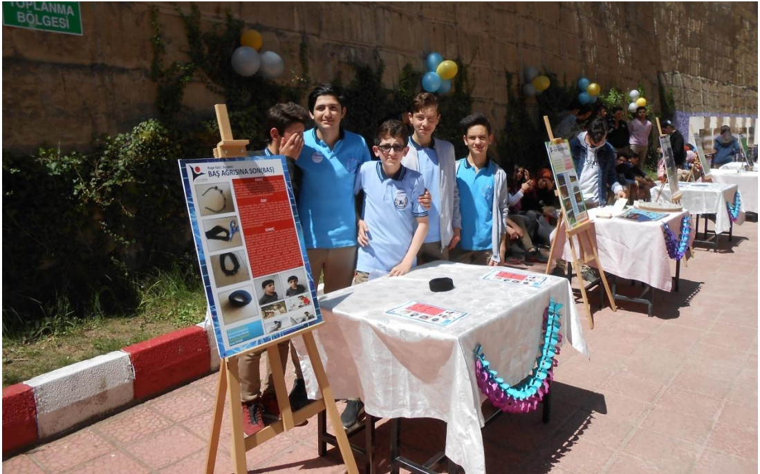
Tübitak Bilim Fuarı